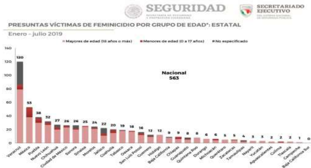
GRAFICA 3: Presuntas Víctimas de Feminicidio 5