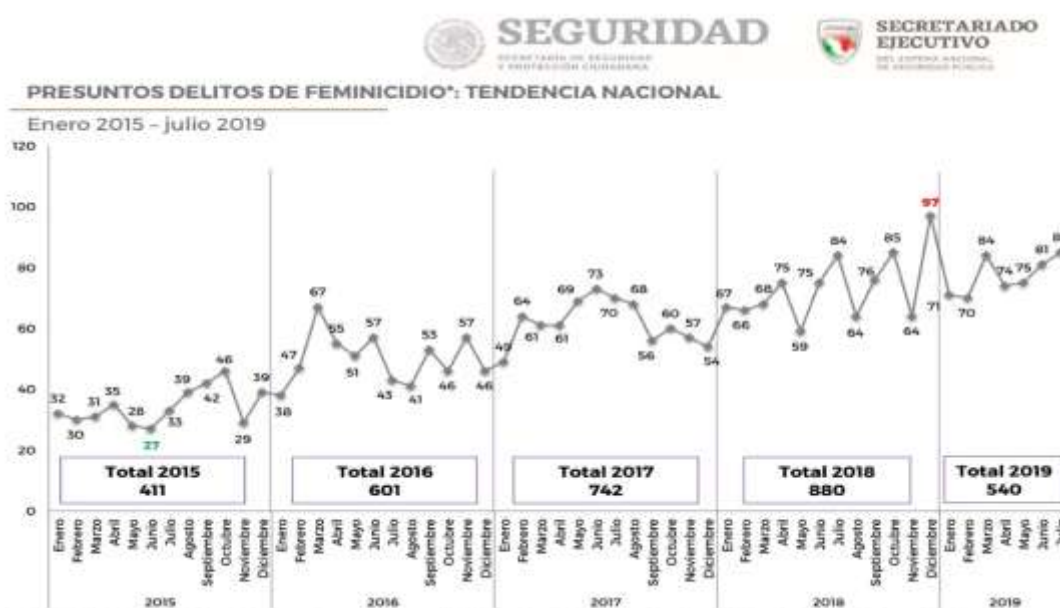
GRAFICA 2: TENDENCIA NACIONAL DE PRESUNTOS FEMINICIDIOS 4

Tratar de entender la magnitud del problema sobre el feminicidio en México, exige de nuestra parte mostrarlo gráficamente, tal vez de esa manera no se nos acuse de propagandísticos y si de académicos preocupados por un fenómeno actual, cuya consecuencia es la muerte de miles de mujeres por la indiferencia con que se le mira, pero no se le ve.